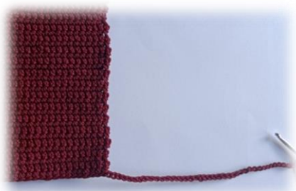
Celkem 59 ok v řadě

35. řada – háčkujeme po řetízku zpět = 59 KS a 1 ŘO na otočení, práci otočíme a háčkujeme zpět